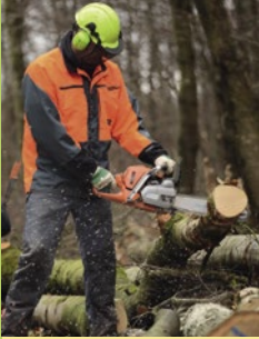
Landesforsten.RLP / Lamour Hansen